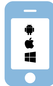
Mobile (über PhoneGap)